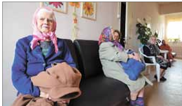
■ Скоро начнется первый сеанс.

Льготы на услуги бань в Архангельске действуют не только для пенсионеров (женщин с 50 лет, мужчин с 55-ти), проживающих в неблагоустроенном жилье, но и для малоимущих, многодетных граждан. Разница между стоимостью помывки и ценой билета компенсируется из городского бюджета. В бане № 19, которая тоже находится на Бревеннике, в этом году запланирован ремонт крыльца и парильного отделения. Такие же работы ожидаются и в бане № 24 на Хабарке. В 2013-м в бане № 15 на Кегострове были оборудованы две душевые, которые сейчас очень востребованы. Более того, помывку можно совместить с посещением парикмахерской, открытой в бане. А уж прачечные как на Кего, так и на Хабарке давно стали спасением для жителей «деревяшек» без удобств. В целом каждую баню на островной территории за неделю посещает порядка 200 человек.