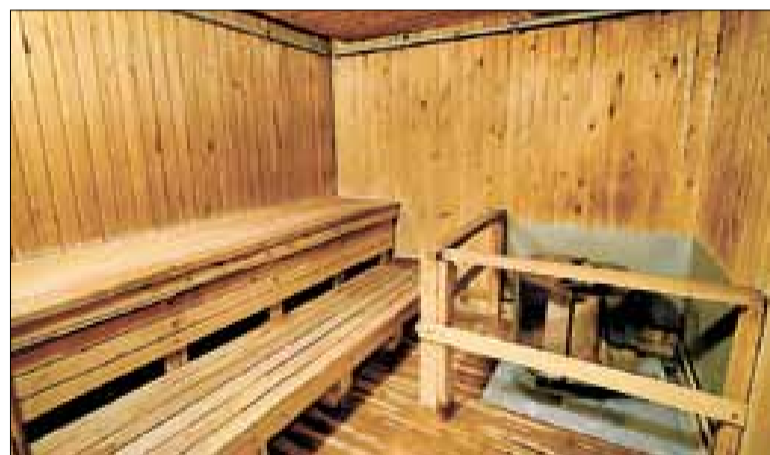
■ Парильное отделение.