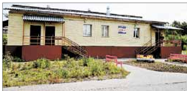
■ Благоустроенная территория радует посетителей.