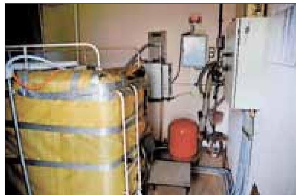
■ «Механическое хозяйство» работает без сбоев.