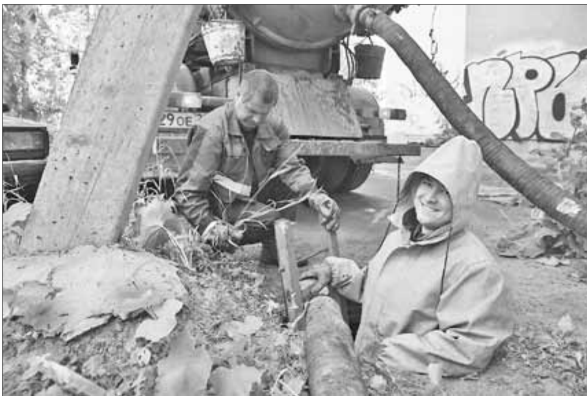
■ Труд это непростой, квалификация рабочего должна соответствовать нагрузке.

Мы решаем, с какой из бригад отправиться на выезд. Выбор падает на чистку дренажно-ливневых колодцев. Валерий Хвиюзов со-